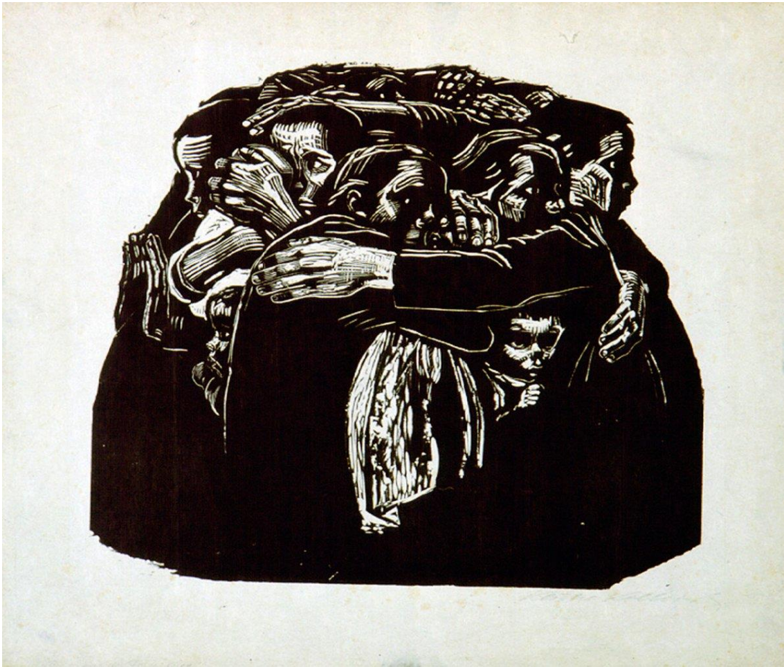
Obra 'As mães' de Kathe Kollwitz, Alemanha. Técnica de Xilogravura, 1923.

KÄTHE KOLLWITZ foi desenhista, escultora e gravadora alemã, nasceu na pequena cidade de Königsberg, em 8 de julho de 1867. Käthe Kollwitz produziu muito em toda sua vida, sempre com foco nos oprimidos, nos famintos, nos injustiçados desenhando cartazes e fazendo ilustrações e xilogravuras denunciando as condições de trabalho, especialmente a situação de vida das mulheres. Desenhou para várias lutas sindicais, entre elas, para o Sindicato das Comunas da Grande Berlim, que denunciava a grande escassez de moradias na cidade. Sofreu censura do governo nazista, como havia sofrido dos imperadores. Se impôs como artista e foi ativa na luta por mais direitos para as mulheres.