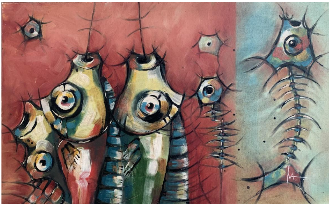
Obra "Eu SER Água" de Iva Tai. Técnica mista 128cmx111cm, 2015 (Acervo da Pinacoteca do Estado do Amazonas)

Nos tempos cinzentos em que a Amazônia, tantas vezes esquecida, é agora atracada pelo gélido abraço da necro-democracia viral, vemos sonhos, cores, esperanças e amores asfixiar. Dentre tantas painas jogadas nos braços do tempo, uma delas se destaca por brilhar em cores e movimentos contra as turvas do dito fim: a artista Iva Tai vítima da Covid-19.